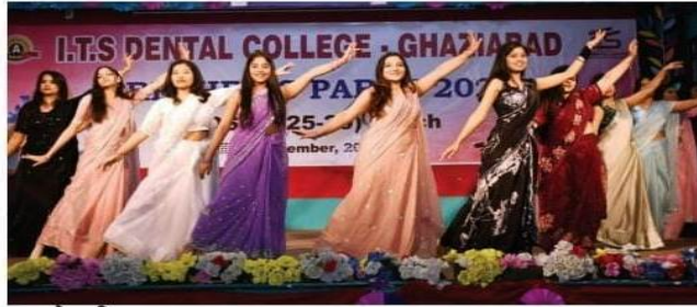
गज केसरी युग

मुरादनगर (मनीष गोयल)। आई.टी.एस डेंटल कॉलेज में फ्रेशर्स पार्टी का आयोजन किया गया। इस उत्सव का आयोजन बी.डी.एस 2024-28 बैच के विद्यार्थियों द्वारा हर्षोल्लास के साथ किया गया।